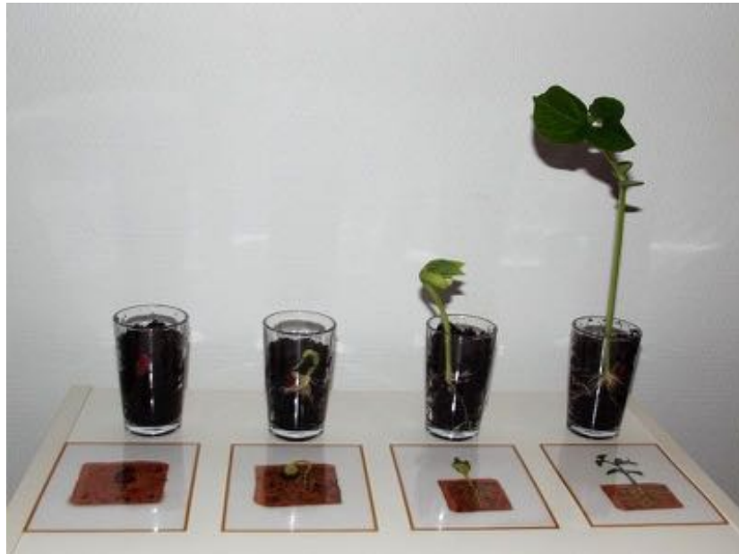
Germination d'une graine de haricot.

Durant ce mois d'avril, tous les élèves du cycle 3 ont enfilé leur tenue de chercheur. Ils sont partis d'une question de départ « Que faut-il pour qu'une graine germe ? ». A partir de là, ils ont fait des hypothèses, mis en place leurs expériences et analysé leurs résultats. Conclusion, une graine a besoin de terre, d'eau et de lumière pour germer. Bravo les grands pour votre travail !