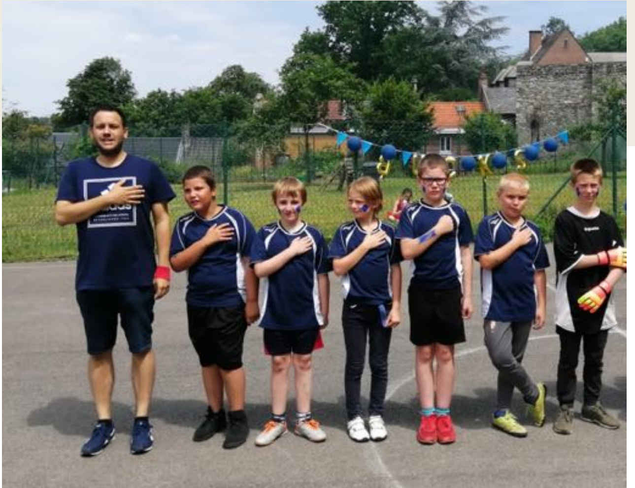
L'équipe des Bucks juste avant la grande finale.