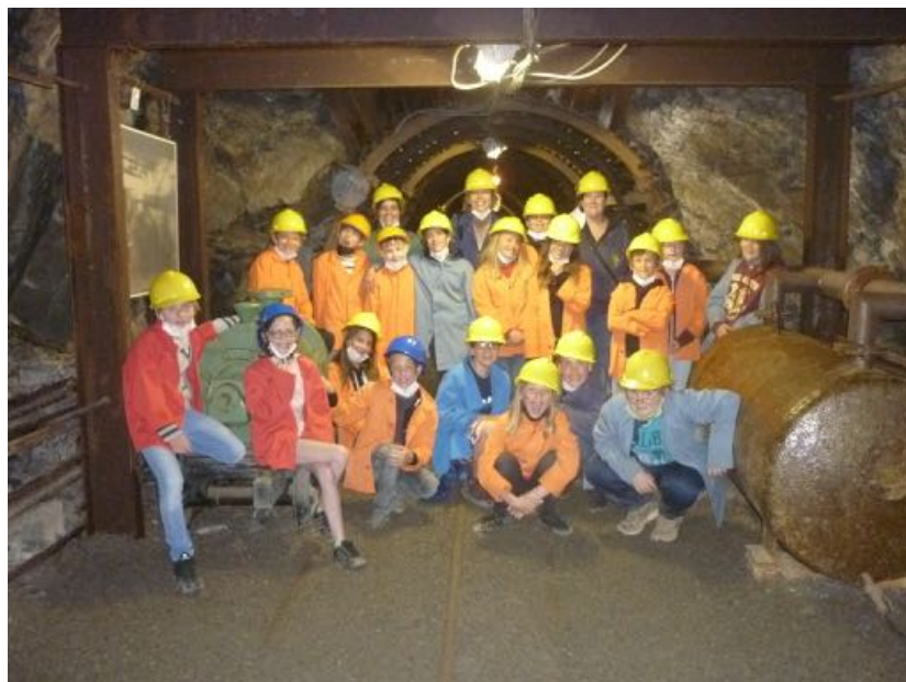
Les élèves du cycle 3 dans la Mine à 60m de profondeur.

Ce lundi 14 juin, tous les élèves du cycle 3 sont partis visiter la mine de Blégny. Ils sont descendus à 60 mètres sous terre et ont découvert la vie des mineurs. Que de découvertes ! Entre les canaris pour déceler la présence de grisou, le marteau piqueur pour creuser la roche, les conditions de vie des hommes et surtout la cage pour atteindre les galeries souterraines les élèves ont passé un super moment. Cette visite a été suivie par un temps libre à la plaine de jeu et une promenade touristique en tortillard. Une super journée passée ensemble qui a fait du bien tant aux enfants qu'à leurs enseignants.