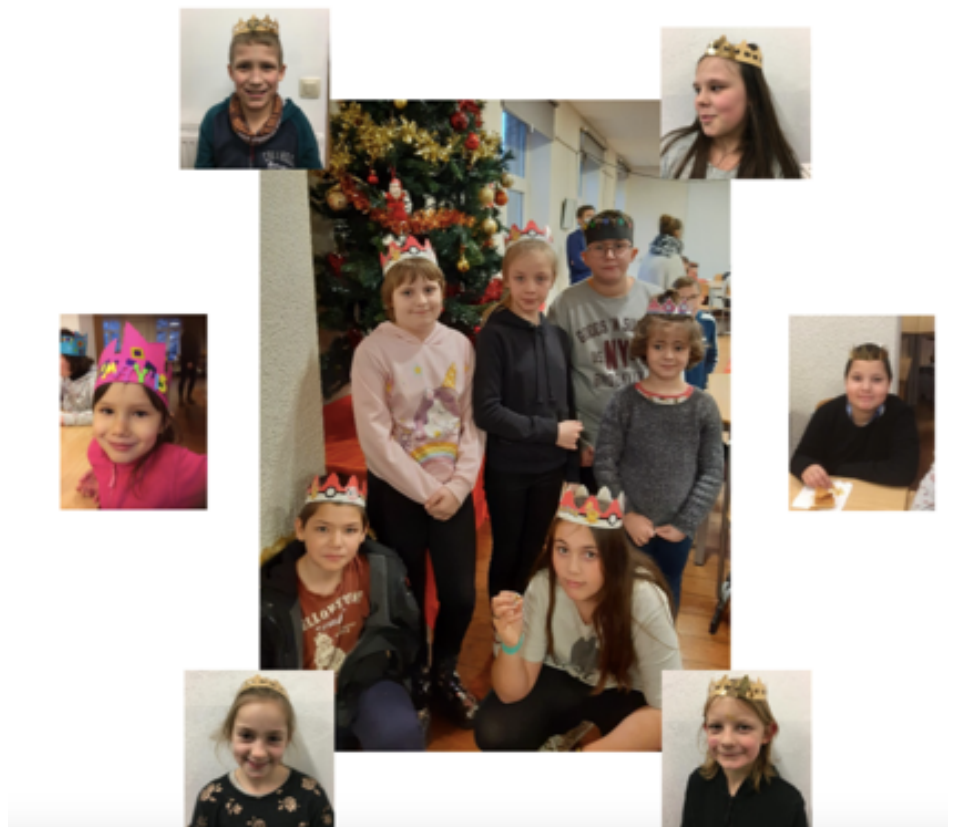
Les Reines et Rois de l'édition 2021.